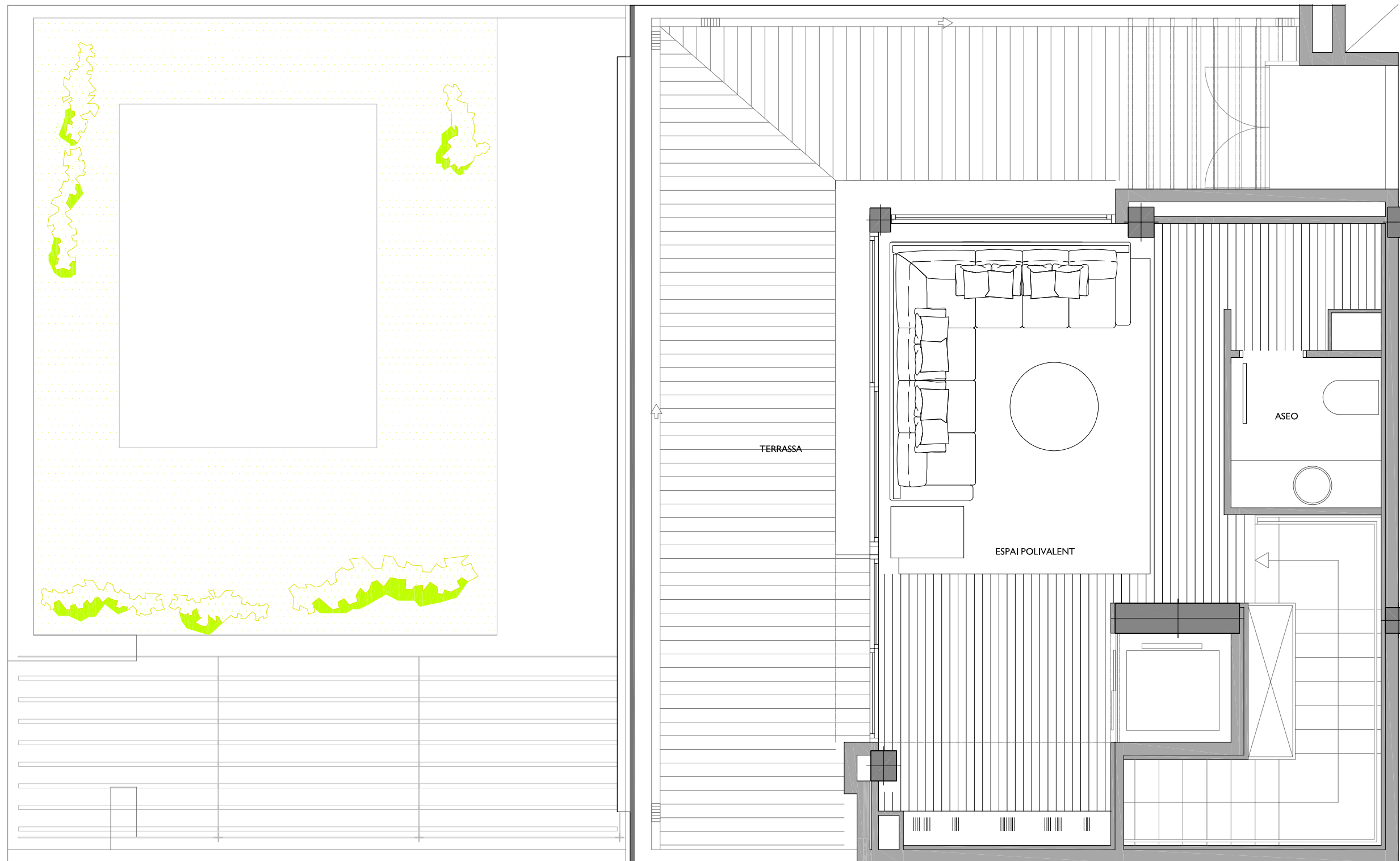
182 B PLANTA 2on PIS Escala 1/50