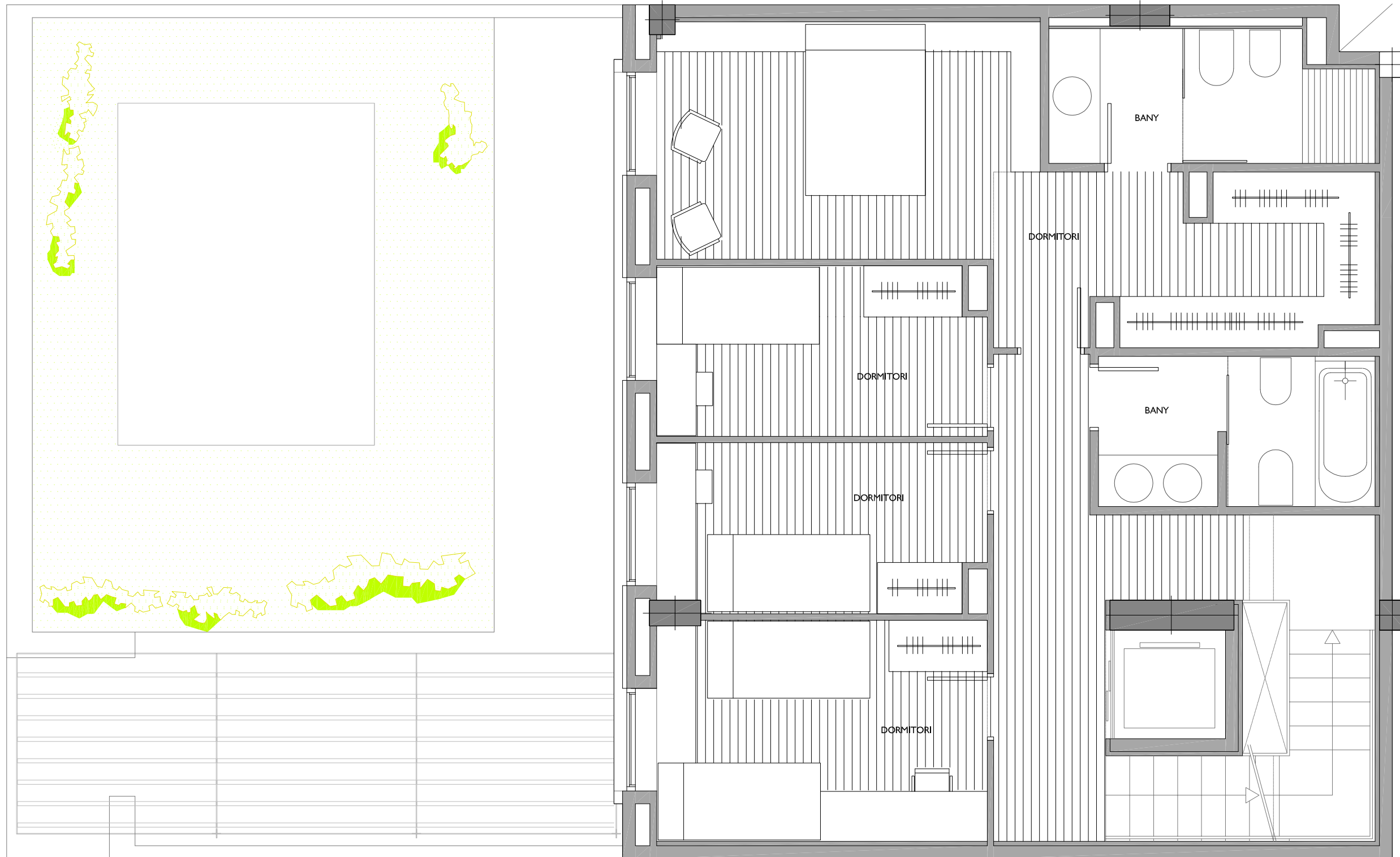
182 B PLANTA 1er PIS Escala 1/50